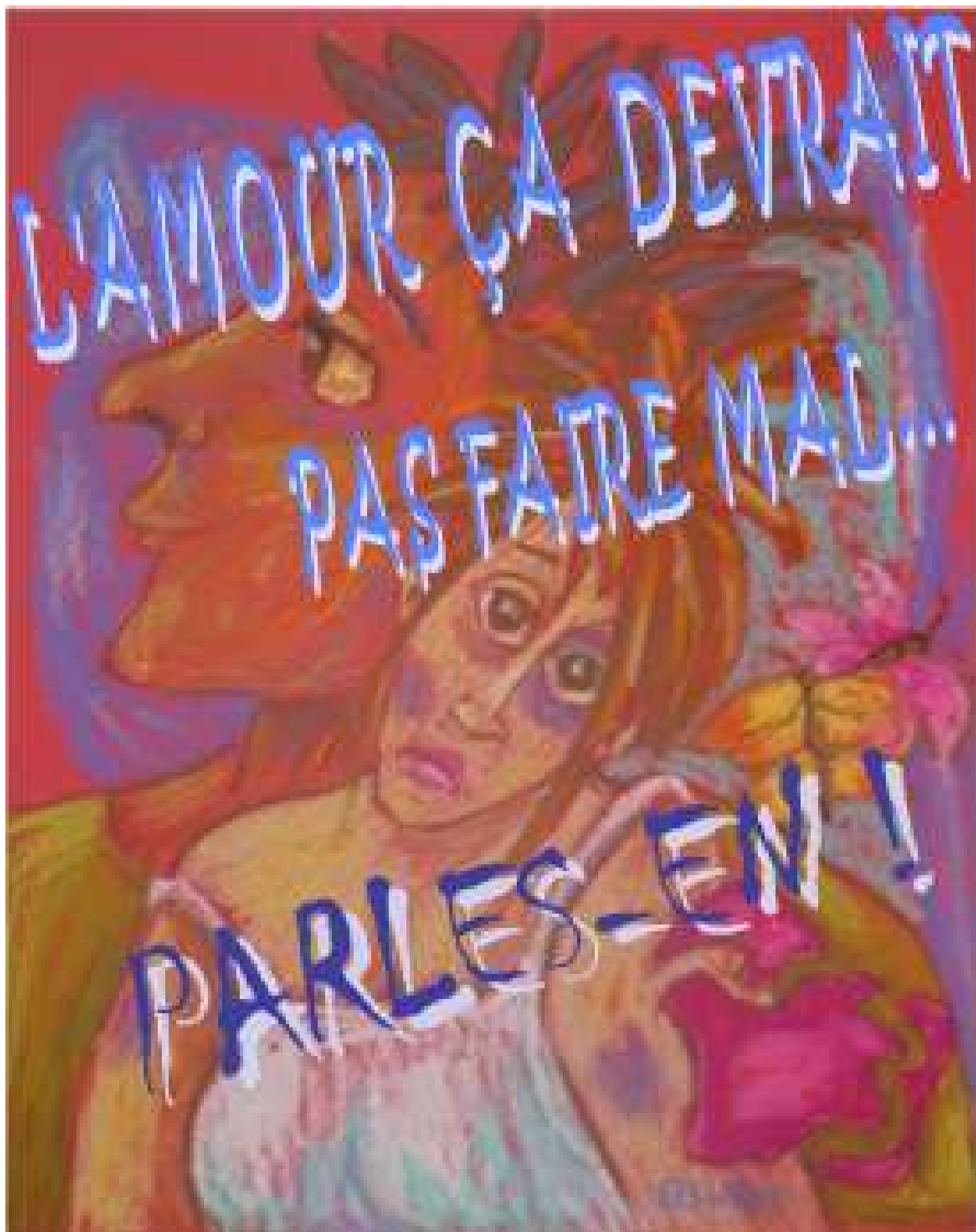
Peinture réalisée par Mme Danielle Bolduc de Notre-Dame-de-Montauban